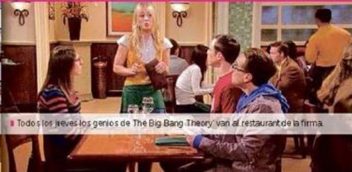
■ Todos los jueves los genios de The Big Bang Theory van al restaurant de la firma.