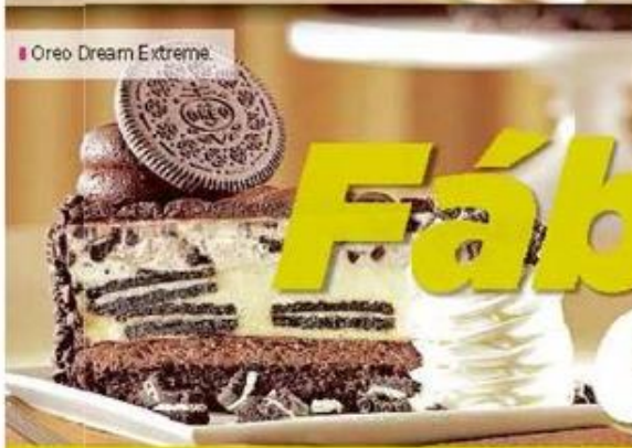
■ Oreo Dream Extreme.