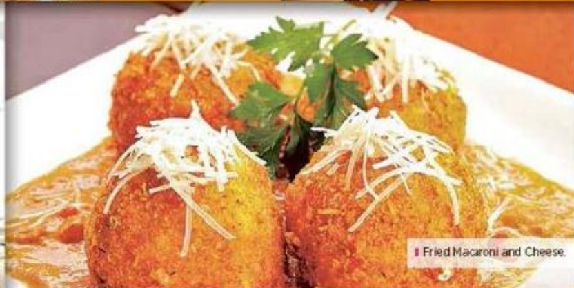
■ Fried Macaroni and Cheese.