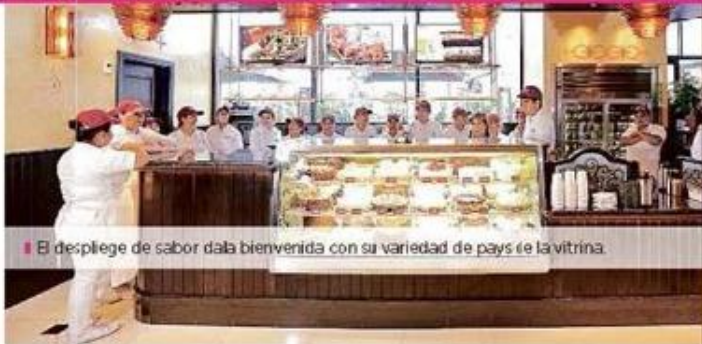
■ El despliegue de sabor da la bienvenida con su variedad de pays en la vitrina.

THE CHEESECAKE FACTORY: DÓNDE: Galerias / CUANDO: Lu a Ju, 12:00 a 23:00; Vi y Sá, 12:00 a 0:00; Do, 10:00 a 22:00 / UN TIP: En esos días de reciente apertura, la espera por una mesa puede ser hasta de 45 minutos; pide que te asignen en la barra o en las mesas del bar y no tendrás que esperar tanto.